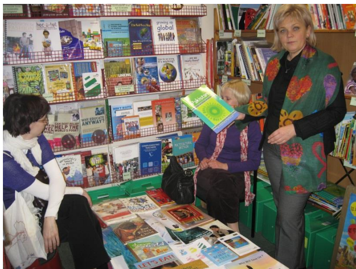
Izpētes vizītes dalībnieki no Latvijas iepazīstas ar Līdsas AIC resursu centra materiāliem

Līdsas AIC ikvienam piedāvā arī iespēju iesaistīties centra darbībā – ar ziedojumiem , kurus ērti var izdarīt arī internetā ar pasaulē drošām maksājuma sistēmām PayPal vai tml.