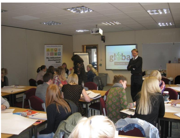
Pēdējā kursa izglītības zinātnu un pedagoģijas studenti piedalās Līdsas AIC nodarbībā

Starpskolu projekti notiek arī Līdsas AIC sadarbojoties ar citām organizācijām – sadarbībā ar Fairtrade skolēni piedalās filmu uzņemšanā par godīgas tirdzniecības tematiku, skolēni iesaistās konkursā par labāko ēdienu recepti, kas gatavota no godīgas tirdzniecības produktiem. Lai skolēnus motivētu, notiek labāko skolu un projektu apbalvošana, populāri ir arī dažādi konkursi un sacensības.