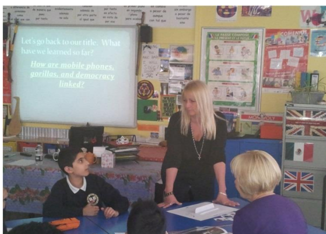
Attīstības izglītības stundu vērošana 6.klasē

Apvienotās Karalistes skolās ļoti populāras ir dažādas izglītības balvas . Tā ir arī viena no pedagogu motivācijām iesaistīties, lai piedalītos, piemēram, Global Teacher Award , Fair Trade Schools Award , Global Schools Award un līdzīgu nomināciju iegūšanā.