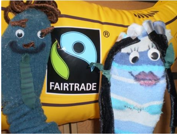
Līdsas AIC nodarbību par godīgo tirdzniecību materiāli

Fairtrade jeb godīgās tirdzniecības skolas darbojas gan informācijas izplatīšanas un izglītošanas kapacitātē skolas ietvaros un vietējā kopienā, gan arī mēģina godīgās tirdzniecības principus ieviest skolas ikdienas dzīvē, piemēram, nodrošinot, lai skolā būtu pieejami godīgās tirdzniecības produkti.