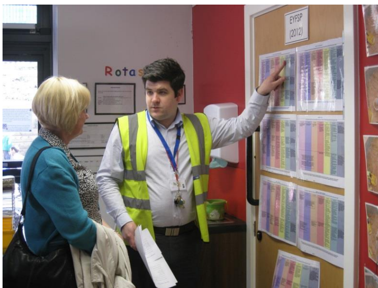
Bankside sākumskolas direktors skaidro britu izglītības specifiku – skolēnu dalījumu pa zināšanu un prasmju līmeņiem

5-11 gadi - sākumskola ( primary school ). Skolēni apgūst 12 priekšmetus, kuru daudzums palielinās atkarībā no vecuma. Anglijā (un arī Velsā un Ziemeļīrijā) ir 3 tipu pamatskolas - infant (5-7g.v.), junior (7-11g.v.), combined (5- 11g.v.).