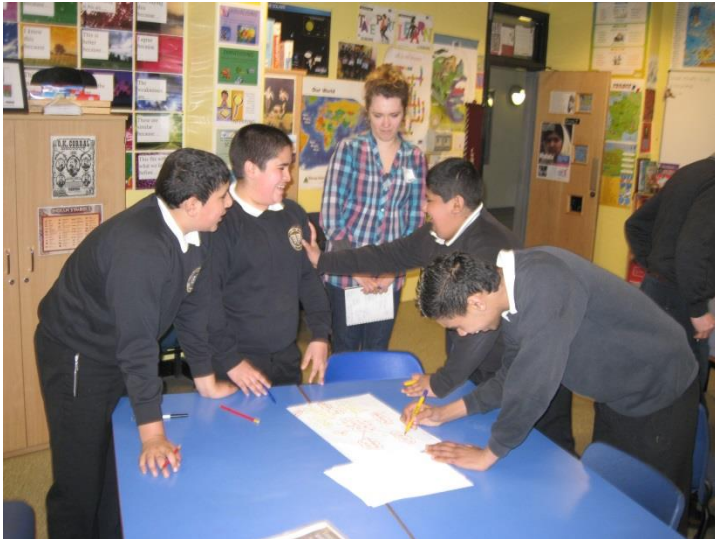
Belle Vue zēnu skolas nodarbība par mijiedarbību starp dažādām valstīm